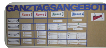
Schule mit ganztägigen Angeboten